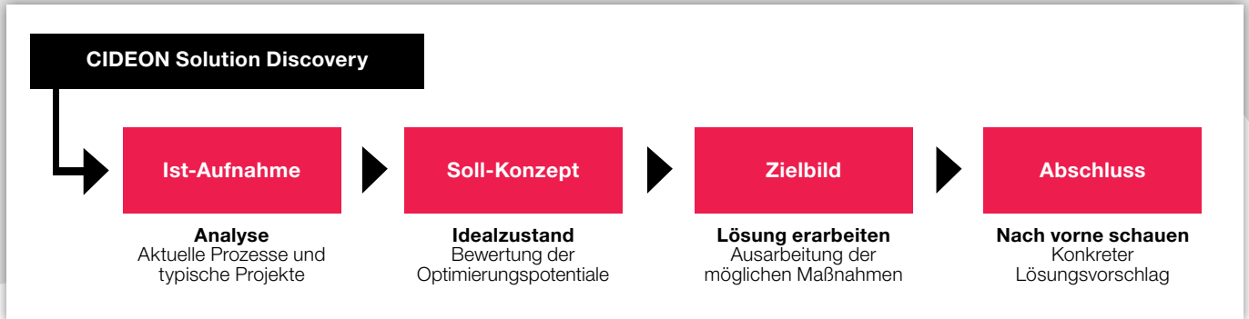
Kernphasen des CIDEON Solution Discovery